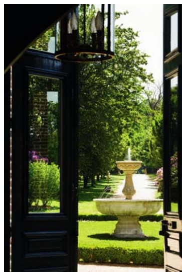
1 - Hall d'entrée du château 2 - Arrivée au château en hélicoptère 3 - La cour d'honneur et sa fontaine vue du hall