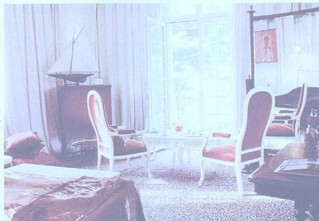
© Domaine Saint Clair - Le Donjon

2-31221928, fax 31226874; www.chateaugoville.com La doppia parte da 85 euro, colazione 13 euro) è un castello del XVIII secolo trasformato in un hôtel di charme. Le 10 camere (più una suite) sono eleganti e sontuose, arricchite con tappezzerie e tende colorate. Imperdibile la colazione, con le torte e le confitures di pera e rosa, tutte fatte in casa.